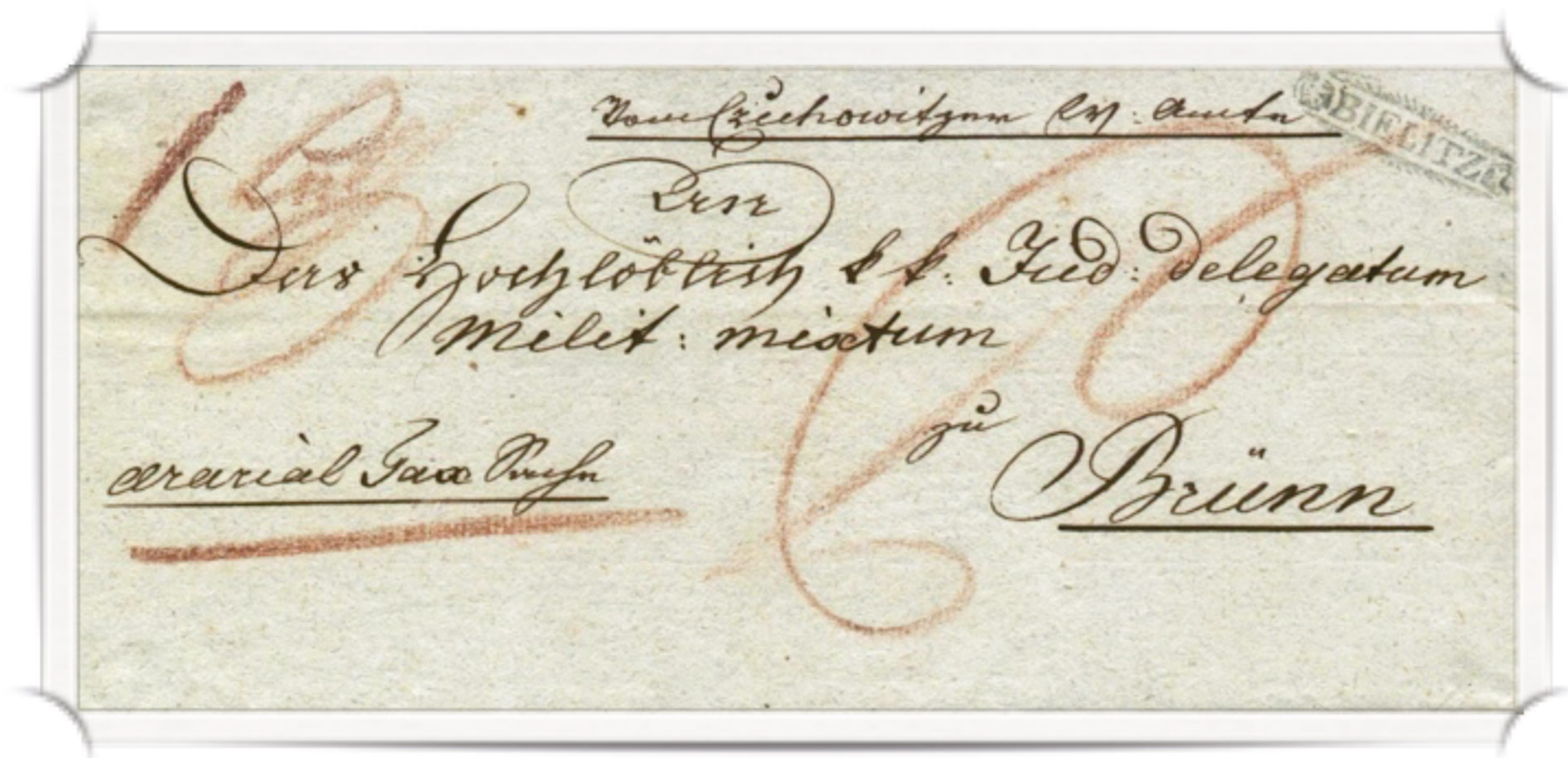
Ryc. 1. List nadany w 1837 roku w Czechowicach za pośrednictwem urzędu pocztowego w Bielsku. W okresie przedznaczkowym nadawca listu zobowiązany był do zapisania w jego górnej części miejsca nadania.

Uruchomienie urzędu pocztowego w Dziedzicach nastąpiło w 1869 roku jednak świadczenie przez pocztę regularnych usług pocztowych nastąpiło znacznie wcześniej. W 1744 roku zaczął funkcjonować w Bielsku urząd pocztowy, dla którego Czechowice, Dziedzice i inne sąsiednie miejscowości znalazły się w jego okręgu doręczeń. Świadczy o tym pochodząca z pierwszej połowy XIX wieku korespondencja (Ryc. 1). Przekazanie korespondencji do urzędu pocztowego w Bielsku odbywało się za pośrednictwem listonoszy. Na poczcie dominował w tym czasie transport dyliżansowy.