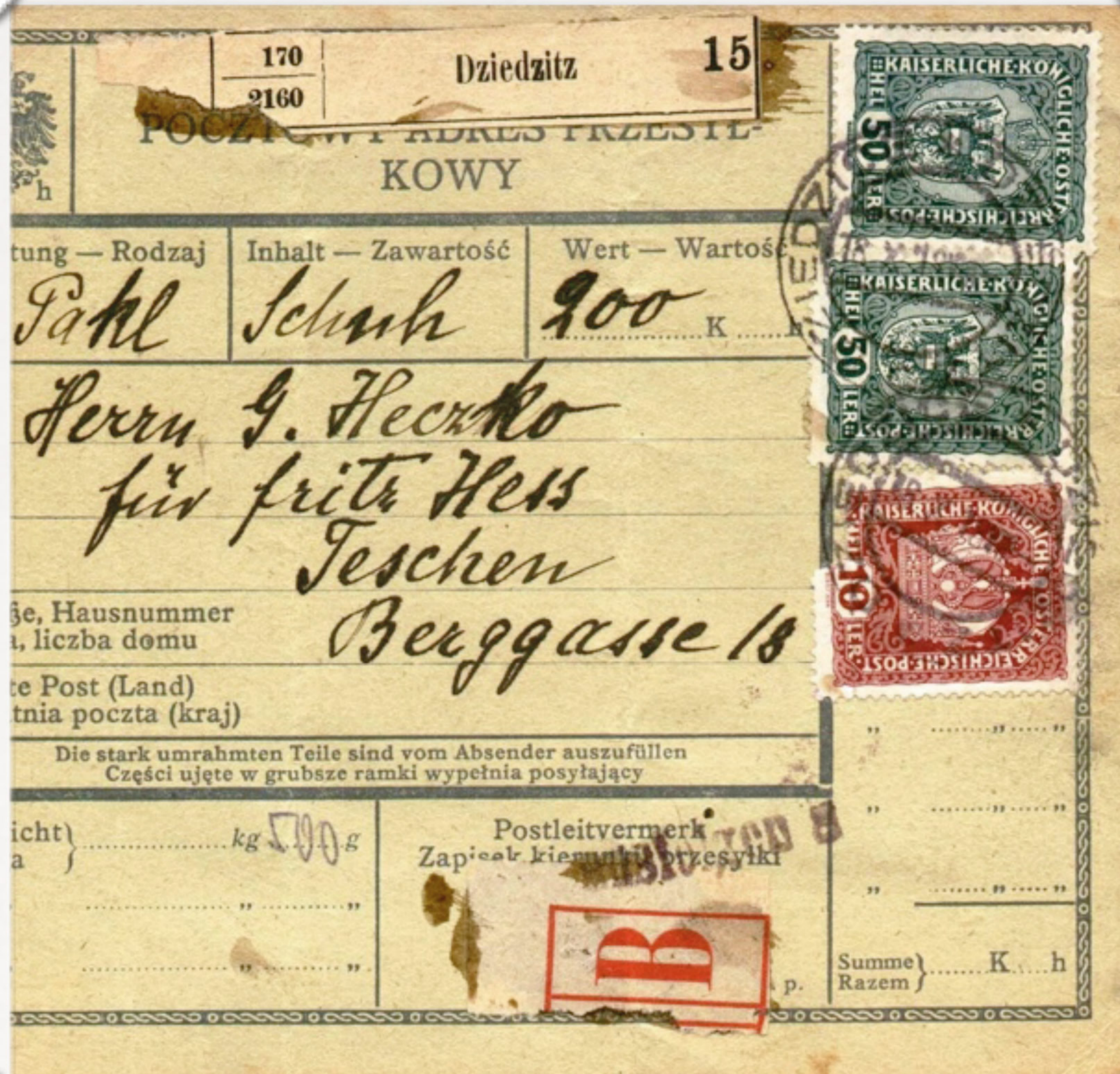
Ryc. 5. Adres przesyłkowy paczki nadanej w Dziedzicach w 1918 roku. Na dokumencie użyto nalepki o potrójnej numeracji. Liczba 170 oznacza numer okręgu pocztowego, liczba 2160 to numer podokręgu pocztowego. Dane te potrzebne były do obliczenia opłaty pocztowej. Numer 15 oznacza kolejny numer paczki.