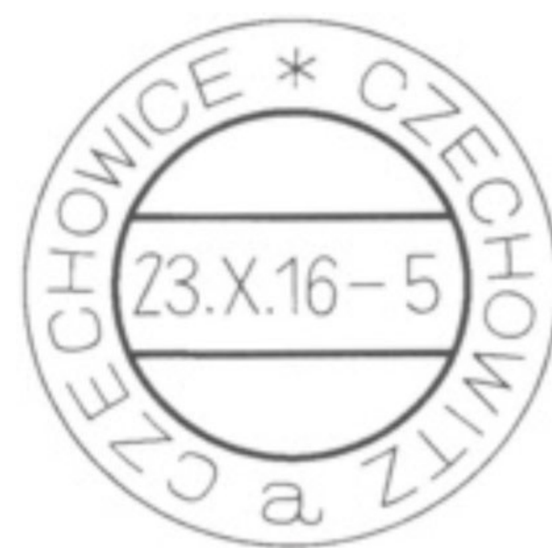
Ryc. 6. Przekaz pieniężny nadany w Czechowicach w 1918 roku. Dla potwierdzenia kontroli został na nim odcisnięty stempel okręgowy XI/26.

Poczta w Czechowicach została uruchomiona 1 czerwca 1907 roku. Z okresu funkcjonowania w mieście poczty austriackiej znany jest tylko jeden datownik pocztowy prezentowany poniżej.