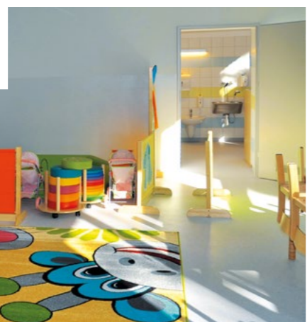
Pomieszczenia nowego ŻŁOBKA MIEJSKIEGO przy ul. Targowej 6 w połowie października br. były już prawie gotowe.

W październiku na ostatniej prostej znalazły się prace przy adaptacji pomieszczeń, w których od listopada będzie się mieściła nowa siedziba Żłobka Miejskiego w Czechowicach-Dziedzicach. Żłobek – działający dotąd w budynku przy ulicy Mickiewicza – jest przenoszony do zaadaptowanych kosztami prawie miliona osmiuset złotych pomieszczeń, które w związku z reformą edukacji i likwidacją gimnazjów udało się wygospo-