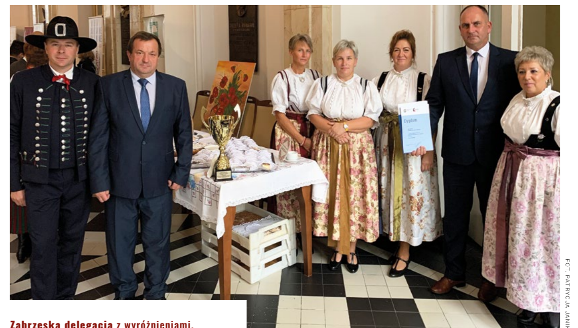
Zabrzeżka delegacja z wyróżnieniami.