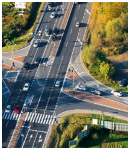
(ZDJĘCIE ILLUSTRACYJNE)

Zgodnie z art. 10 ustawy z dnia 12 stycznia 1991 roku o podatkach i opłatach lokalnych, rada gminy określa w drodze uchwały wysokość stawek podatku od środków transportowych, przy czym stawki ustalone przez radę nie mogą być niższe od stawek minimalnych ustalonych w obwieszczeniu Ministra Finansów, Funduszy i Polityki Regionalnej z dnia 8 października 2020 r. w sprawie stawek podatku od środków transportowych obowiązujących w 2021 r. ani też wyższe od stawek maksymalnych ustalonych w obwieszczeniu Ministra Finansów z dnia 23 lipca 2020 r. w sprawie górnych granic stawek kwotowych podatków i opłat lokalnych ▶