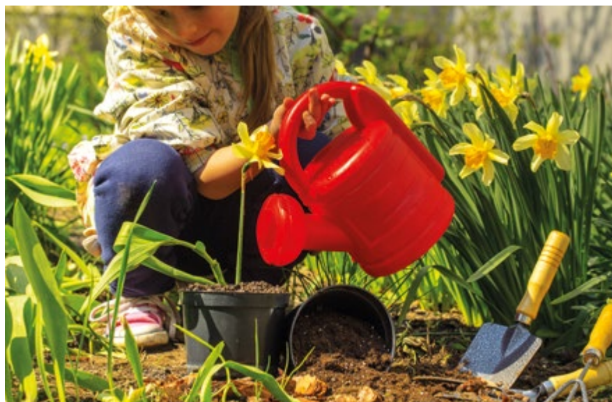
FOT. PVPRODUCTIONS / FREEPK.COM / ZDJĘCIE ILUSTRACYJNE

szukamy daleko tego, co okazuje się być na wyciągnięcie ręki, trzeba tylko wiedzieć, gdzie szukać... Dzięki ulokowaniu w obiekcie i prowadzeniu przez CEE Punktu Informacji Turystycznej i promocji regionu, uczestnicy zajęć mają okazję poznać także m.in. infrastrukturę szlakową i turystyczną nie tylko gminy, ale również regionu (szlaki turystyczne i trasy rowerowe) oraz różnorodność naturalną i kulturową pogranicza trzech państw (Euroregion Beskidy). Gminne i regionalne trasy rowerowe, szlaki turystyczne i historyczne (np. Szlak dziedzictwa Czechowic-Dziedzic) i ścieżki edukacyjne (np. leśna ścieżka edukacyjna w Zabrzegu) to plenerowa oferta naszej gminy, którą warto promować, nie tylko wśród młodego pokolenia, zachęcając do aktywnych form nauki i spędzania wolnego czasu. Zajęcia te mają na celu zachęcenie do uprawiania krajoznawstwa i turystyki w jego ekologicznych oraz przyjaznych naturze formach, a nauka czytania mapy turystycznej i poznanie tajników orientacji terenowej i bezpiecznego zachowania i poruszania się w terenie – również z poszanowaniem siedlisk roślin i zwierząt, nie tylko tych odwiedzanych w rezerwach i użytkach ekologicznych – to kwestie, o których wiedzę warto przekazywać i zaszczepiać. Tematykę przyrodniczo-hydrologiczną poruszają zajęcia „Miejskie środo-